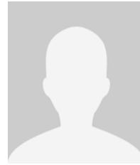
Guillermo Correa Ing. Civil industrial